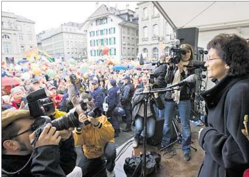
Bundesrätin Eveline Widmer-Schlumpf gestern während ihrer Rede auf dem Bundesplatz.

Alt Bundesrat Christoph Blocher verteidigte seinerseits gestern in einem Interview der «Neuen Zürcher Zeitung» («NZZ») das Ultimatum und wiederholte die Vorwürfe an seine Nachfolgerin im Bundesrat: Sie habe gegen die Interessen der Partei verstossen. (sda) Seite 15